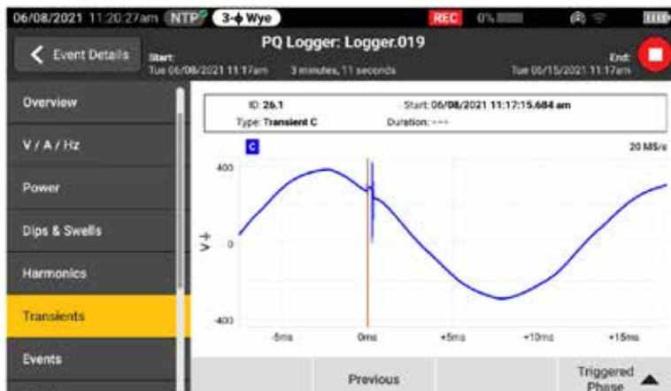
查看实时电压瞬变事件，同时进行记录以加快故障排除

瞬变每天都会对原本运行状况良好的系统产生负面影响，其对设备的损坏潜力不可低估。无论您的系统是发生脉冲瞬变还是振荡瞬变，结果都可能是毁灭性的，会导致从绝缘失效到整个设备出现故障等各种问题。Fluke 1775 和 Fluke 1777 采用了先进的瞬变捕获技术，可帮助您清晰地识别高速电压瞬变，这样您便可以获得阻止其发生所需的数据。Fluke 1775 Power Quality Analyzer 具有 1MHz 采样功能，可捕获快速瞬变，而 Fluke 1777 Power Quality Analyzer 则具有 20MHz 采样功能，可以捕获最快的瞬变并提供详细信息。