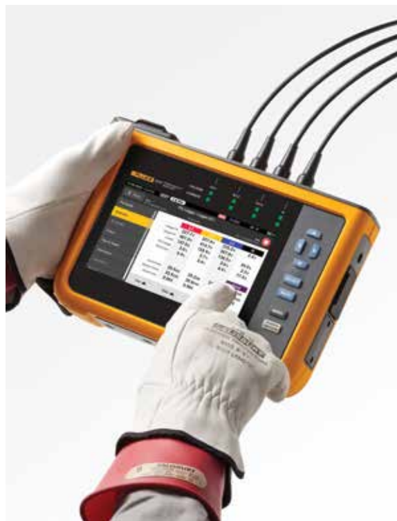
使用大尺寸彩色触摸屏轻松导航

从 Fluke 1770 Series Power Quality Analyzers 下载数据时, 随附的 Energy Analyze Plus 软件包可将电压测量值和电流谐波统计数据与不同标准 (如 EN 50160 或 IEEE 519) 进行比较, 以确定它们是否超出合规性限制。这种强大的预测性维护功能可让您在电压出现失真之前观察到电流谐波, 从而防止意外故障或不合规情况, 延长系统正常运行时间。随着基于逆变器的负载和发电的激增, 控制电流谐波变得越来越重要, 这有助于确保可靠的电能质量并避免系统停机。